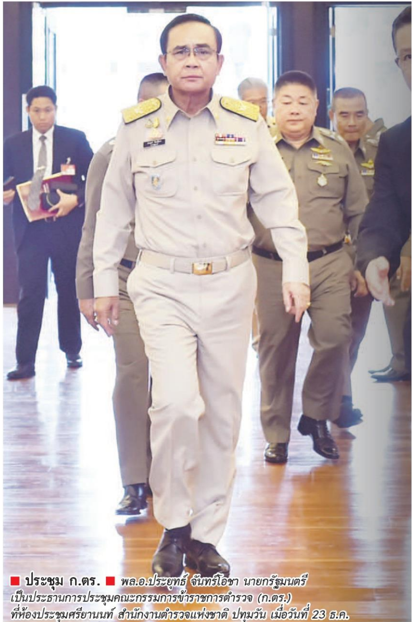
■ ประชุม ก.ตร. ■ พล.อ.ประยุทธ์ จันทร์โอชา นายกรัฐมนตรี เป็นประธานการประชุมคณะกรรมการข้าราชการตำรวจ (ก.ตร.) ที่ห้องประชุมศรียานนท์ สำนักงานตำรวจแห่งชาติ ปทุมวัน เมื่อวันที่ 23 ธ.ค.

พล.อ.ประยุทธ์ กล่าวตอนท้ายว่า วันนี้เราทำอย่างไรจะช่วยลดความขัดแย้งลงให้ได้ อย่าเอาความชอบ หรือไม่ชอบตัวบุคคล มาทำสิ่งต่างๆ ที่ต้องทำให้เกิดความเสียหาย ต้องทำงานให้แก่พื้นที่และประชาชนของตนเอง ท่านเป็นนักการเมืองท้องถิ่น เป็น ส.ส. ต้องทำสิ่งที่ดีให้กับคนในพื้นที่ และต้องยึดมั่นในหลักการ ไม่เช่นนั้นก็ไปกันไม่ได้ทั้งหมด เราต้องแยกแยะ